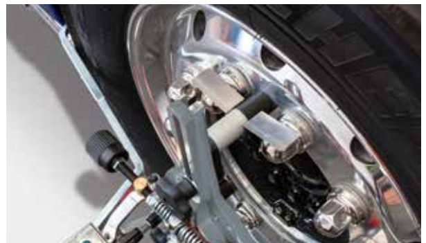
Halteklammern für Alufelgen