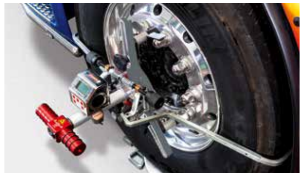
Laserkopf und Neigungswinkelmesser