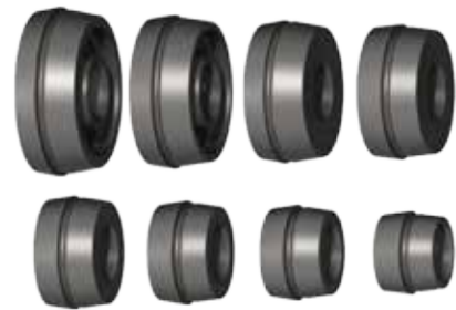
8 Präzisions-Konen Artikel-Nr.: 150 400 121